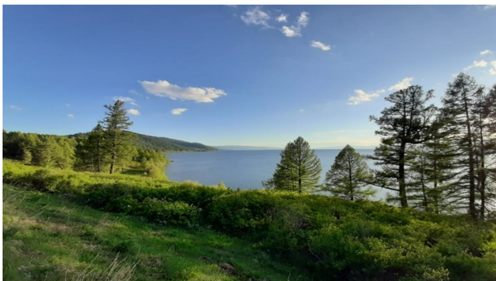
Рисунок 1 – Озеро Маркаколь

Введение. Озеро Маркаколь — крупнейший водоём Алтая (см. рисунок 1). Оно имеет овально-вытянутую форму и простирается с северо-востока на юго-запад. Абсолютная отметка поверхности воды составляет 1447 м над уровнем моря. Протяжённость озера достигает 38 км, максимальная ширина — около 19 км. Длина береговой линии — 106 км, площадь зеркала — 455 км 2 . Средняя глубина водоёма равна 14,3 м, а максимальная — 24–25 м. Вода пресная и отличается высокой мягкостью. Общий объём воды в озёрной чаше составляет примерно 6,5 км 3 [1].